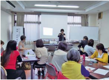
(サポーター研修の様子)

熊谷市社会福祉協議会では、家庭訪問型の子育て相談を実施しています。現在、この事業の「子育てサポーター」として登録をしていただける有資格者（保健師・看護師・保育士・教職員・埼玉県家庭教育アドバイザーなど）の方を募集しています。