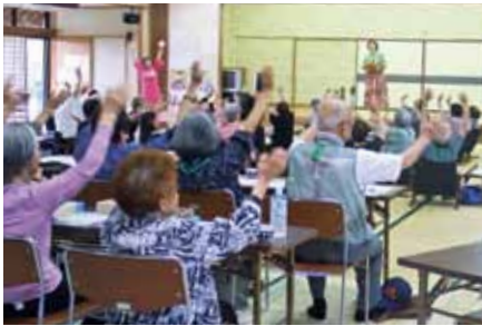
地域ネットワーク友愛事業

福祉協力校活動支援、ボランティアグループへの助成、敬老修繕サービス、歳末ホームクリーニングサービス、ふれあいいきいきサロン、里親活動支援、敬老ボスターコンクール、障がい者団体への助成、地域ネットワーク友愛事業 等