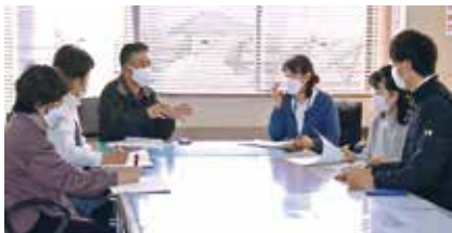
ケアマネ全体の合同研修

熊谷市社協 居宅介護支援事業所 妻沼行政センター内 TEL 048-588-2549