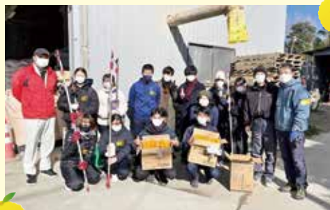
冬至に柚子を児童養護施設へ「ユズりあいくまがやプロジェクト」