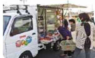
新里保育園駐車場