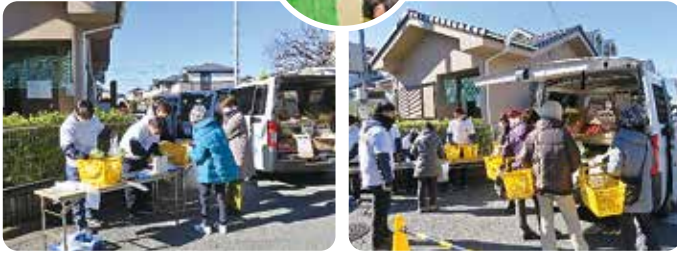
熊谷ハイタウン自治会「高齢者を見守る会」のメンバーが協力してくれています。