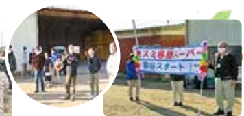
(左) 妻沼小島自治会の皆さんの協力に感謝 (右) いこいの里(包括)

この事業は、熊谷市と株式会社カスミとの協定書に基づき、買い物支援策を実施することにより、買い物に困難を感じている市民を支援するとともに、見守り活動を推進することを目的とした事業です。