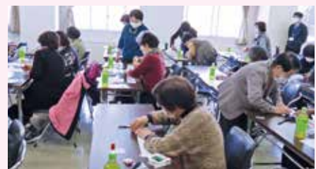
手作りお手玉とクルクル巻き布ネックレスの 作り方講習会 R3.11