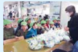
コロナ禍以前の写真です。

詳しくは、認定NPO法人 世界の子どもにワクチンを日本委員会のホームページ https://www.jcv-jp.org/ をご覧ください。