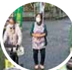
目黒会長の挨拶でスタート