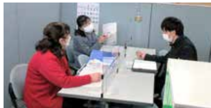
介護保険・医療・福祉等諸制度の研修