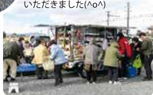
川原明戸：理容室あつて駐車場