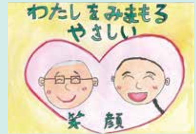
秦小 こつじ ゆいか 唯愛さん