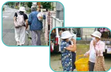
松本民生委員さんから声掛け (近況確認)

今年6月、自治会・民生委員の協力により新たに2つの自治会で「あんしん市場」がOPENしました。「近くにお店もなく困ってたの。助かるわ」などの声。自然とおしゃべりも始まり良い雰囲気の集いの場になっています。 みなさんに喜んでいただいています！