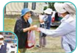
熱中症防止対策 冷たい麦茶提供 ♡クイーンズピラ (包括)