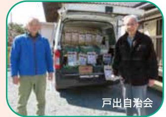
懐メロを流し 会場を和ます料な演出