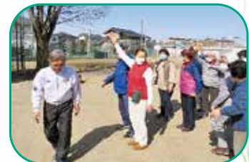
弥太郎公園内をウォーキング