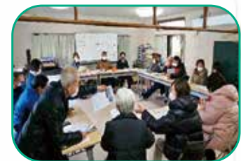
定例会: 月1回実施 (日曜日) 検討会、情報共有