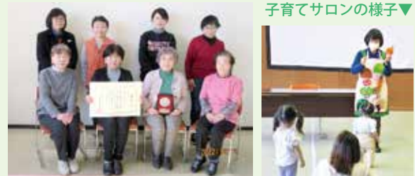
子育てサロンの様子▼