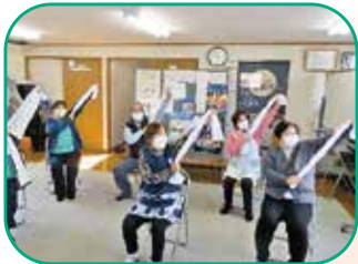
成田山自治会 (たいようの会)

～あんしん市場から健康体操・サロンへ 健康体操・サロンからあんしん市場へ～ 地域住民主体の体操やサロン・見守りなど コミュニケーションの窓口となっています。