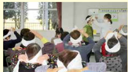
三角巾を使った応急手当の講習会