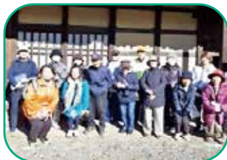
弥太郎公園～樋春: 平山家見学 15名参加