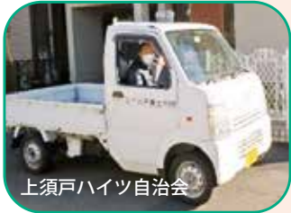
上須戸ハイツ自治会