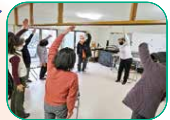
(上) 熊谷ハイタウン自治会 ニャオざね元気体操