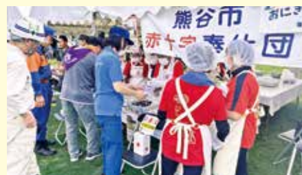
熊谷市総合防災訓練