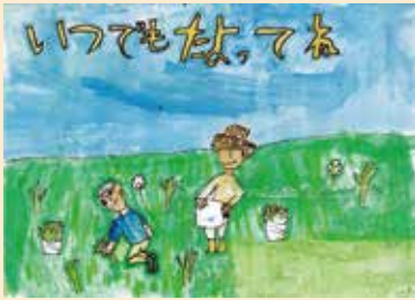
秦小 ふしい 藤井 りひろ 璃大さん