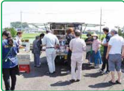
江波台自治会：第1会場