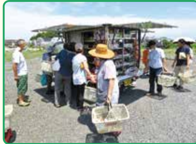
上須戸ハイツ自治会駐車場 拡声器を使い軽トラックで地域を巡回