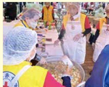
埼玉県赤十字奉仕団炊き出しサミット 2023