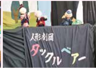
人形劇団タックル・ベアー