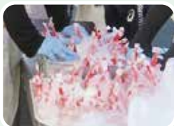
ハイゼックスで炊いたご飯