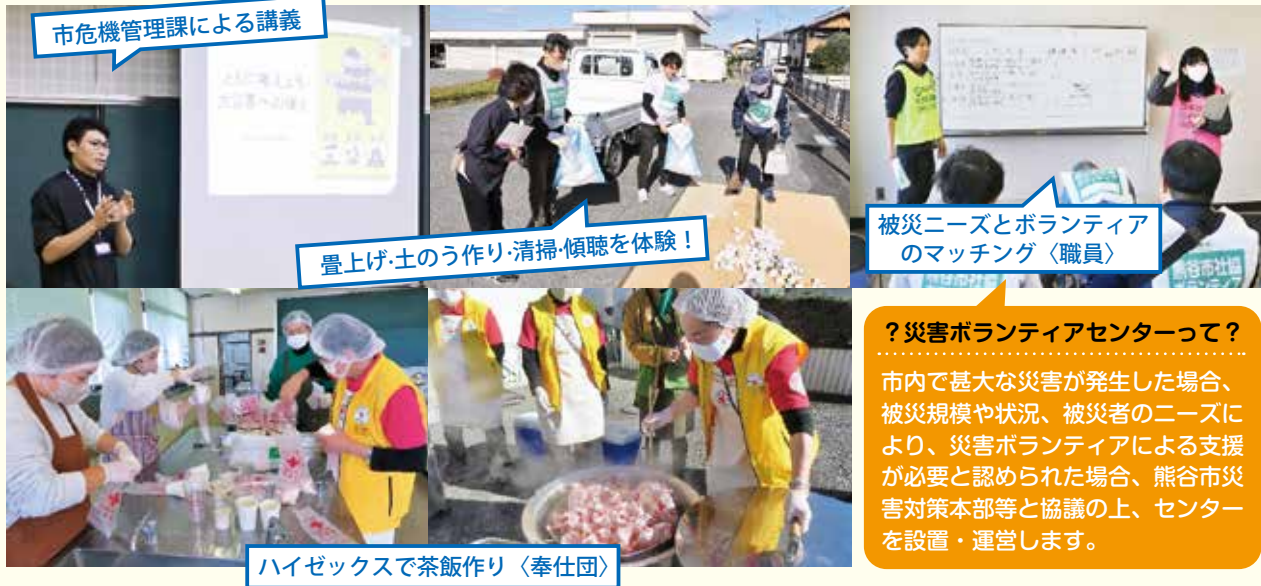
市危機管理課による講義

能登半島地震から1年が経過しました。昨年の元日に地震が発生し、その後も各地で地震や水害などの被害が出ました。能登半島の一部の地域では、今なお電気や水道が復旧していない地域もあります。熊谷市もいつ起こるかもわからない災害に備え、平時の取り組みとして市民登録ボランティアやボランティア連絡会、青年会議所(JC)等の参加をいただき、「顔と顔の見える関係づくり」を目指して、災害訓練を実施しました。