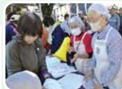
ホットタオル体験