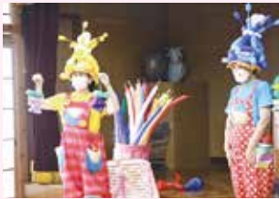
ケアリングクラウン隊