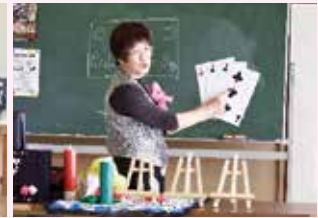
佐谷田マジッククラブ