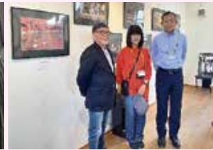
フォトグループくまがや'22