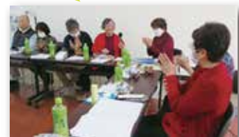
リスナー交流会の様子